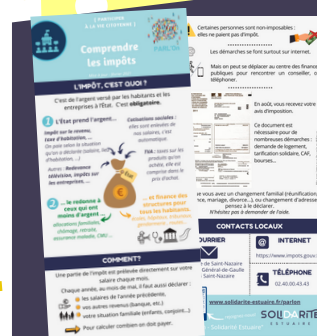
Comprendre les impôts